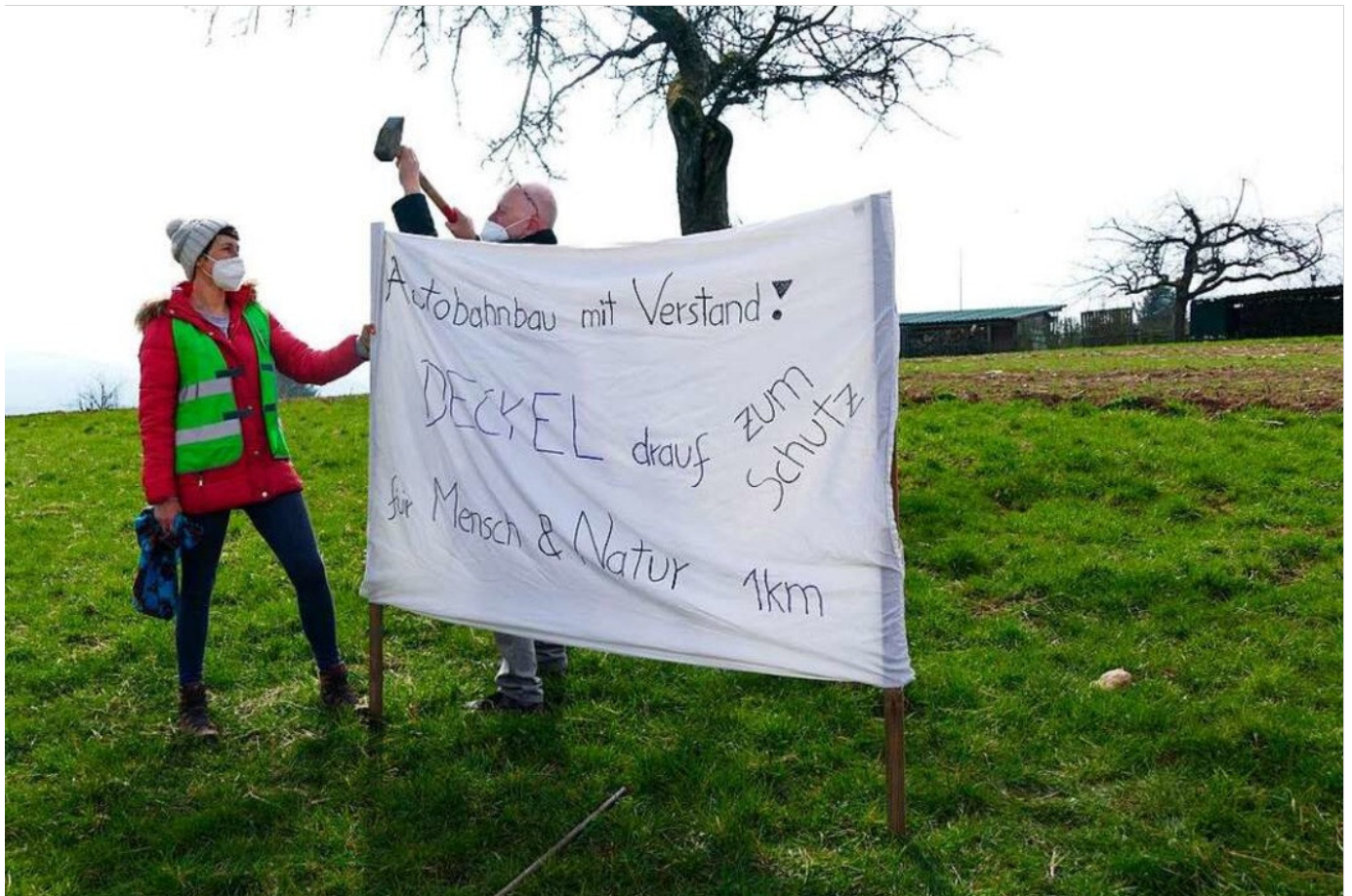
Die Forderungen der BI

Mandatsträger aus Bundestag und Landtag machen in einer Videokonferenz mit dem Verkehrsministerium und der Autobahngesellschaft ihre Position deutlich